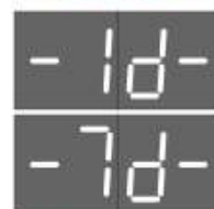
Встановлений тижневий цикл (168 годин)