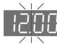
Встановлений добовий цикл (24 години)