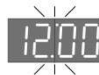
Установлен суточный цикл (24 часа)

Примечание: Если Вы не пользуетесь обогревом с программой, но хотите видеть на индикаторе не только температуру, но и текущее время, то задайте значение для режима 'E' = 0.0 (если заводская программа не менялась) или установите для каждого часа суточного цикла режим 'С'. Включите работу с программой.